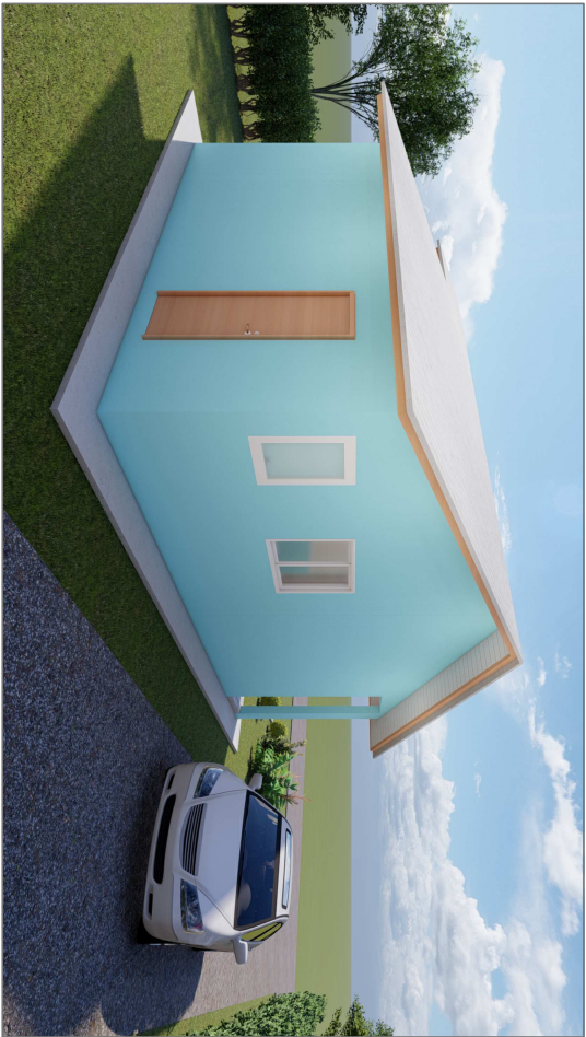
Perspectiva 3D-02 Sem escala